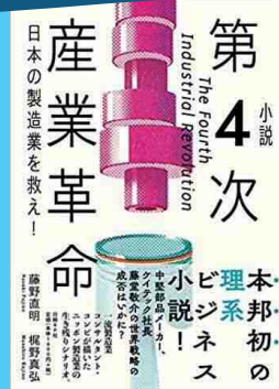
『小説 第4次産業革命 日本の製造業を救え!』 日経BP社

業務革新・事業成長・技術継承の実現をめざす地域製造業の企業経営層の方々にぜひ参加していただきたいプログラムとなっております。